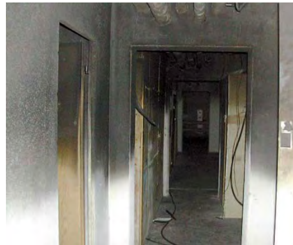
Die Spuren des Brandes

Haben Sie sachdienliche Hinweise, so können Sie sich vertrauensvoll an Ihren Hausmeister oder Kundenbetreuer wenden, darüber hinaus natürlich auch an die Polizei.