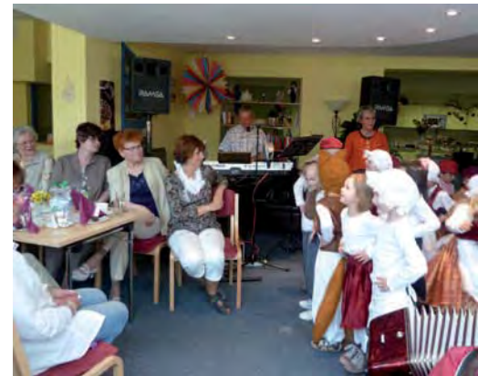
Aufmerksame Zuhörer beim Programm der Kinder

Die Musik mit DJ Röschen ließ manche Knieschmerzen vergessen und animierte zum Tanzen.