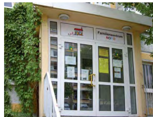
Der Eingang zum Familienzentrum

Familienbüro: Anlaufstelle für Fragen rund um die Familie Sprechzeiten: Dienstag 10 - 12 Uhr und Donnerstag 14 - 16 Uhr