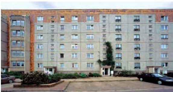
Die August-Milarch-Straße im Katharinenviertel

Am 07. Mai 2011 wurde unserem Havariedienst in der BAU-REGIE gegen 6:45 Uhr ein Kellerbrand in der August-Milarch-Str. 6 gemeldet. Mehrere Personen mussten zur Kontrolle ins Klinikum gebracht werden. Um 7 Uhr waren bereits die wesentlichen technischen Störungen beseitigt, ausgenommen die Warmwasserversorgung und Telekom.